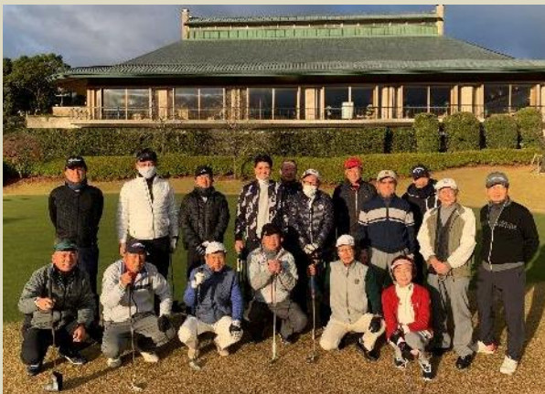
スタート前に参加者の皆さんと記念撮影

南NO,2 L大橋 NO,5 L嘉和知 北NO,4 L景山 NO,15 L森戸 BGは91でL大橋