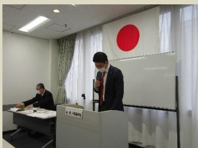
会長挨拶会長L森戸