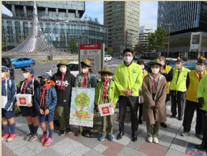
駅前交番付近で募金活動(ボーイスカウト名古屋第67団)