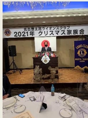
出席率の報告L伴野