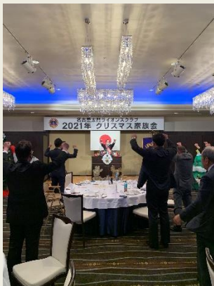
ライオンズローアをL景山