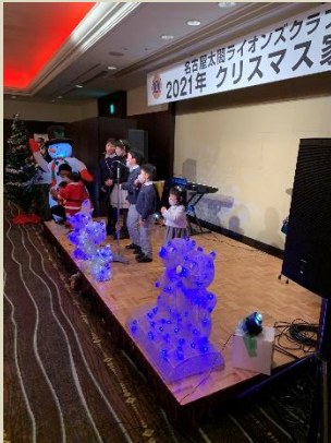
子供達と歌うジングルベル