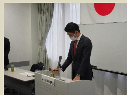
閉会のゴングを会長L森戸