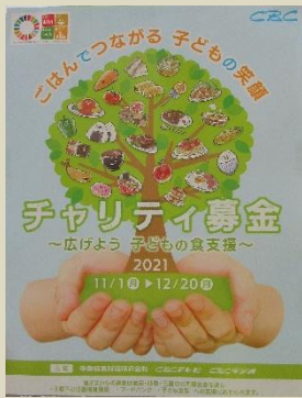
チャリティ募金ー広げよう子供の食支援ー