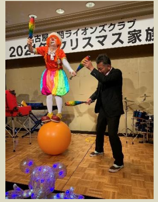
クラウンみっきーさんのパフォーマンス