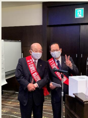
テーブルツイスタータイム