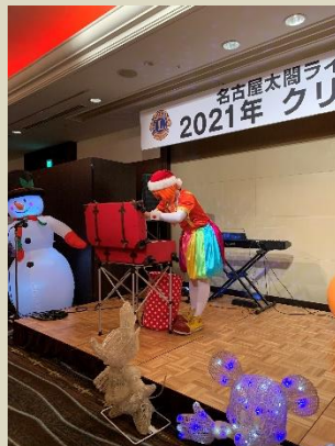
クラウンみっきーさんのパフォーマンス