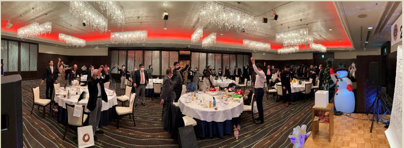
また逢う日までをソーシャルディスタンスを取って行いました。(パノラマ撮影)