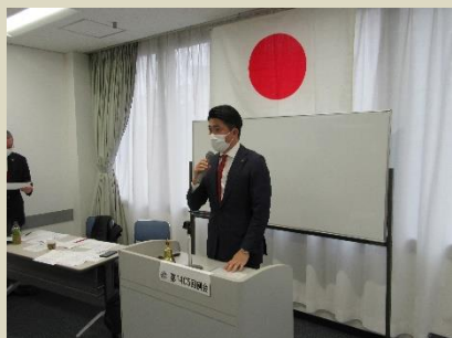
開会のゴング会長L森戸