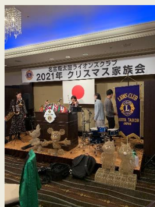
クリスマスの準備の様子