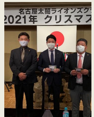
誕生日祝いの贈呈