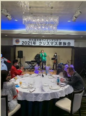
乾杯の発声はL伴野