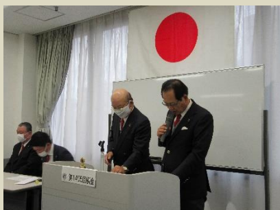
テールツイスタータイムTTL景山副TTL伊藤