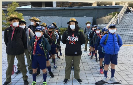
9時30分にはボーイスカウト名古屋第67団の朝礼が行われる