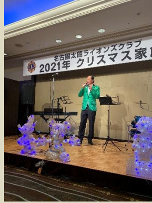
オープニングはL伴野