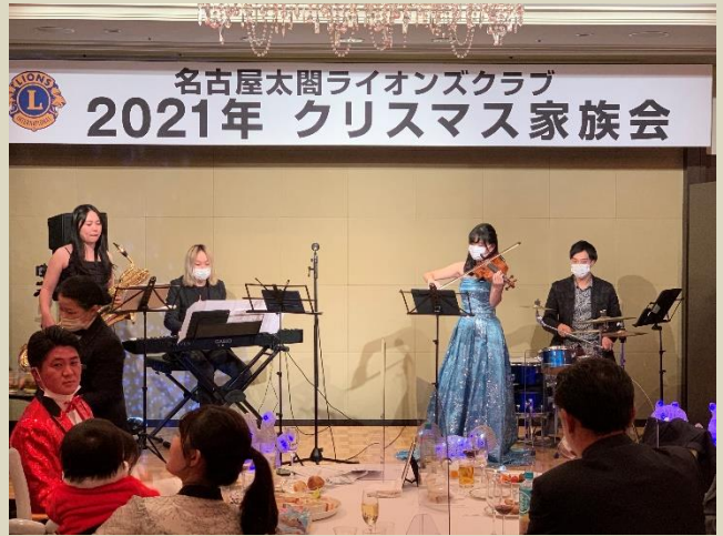
Jumble Quartet(ジャンブルカルテット)の演奏