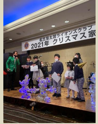
子供達と歌うジングルベル