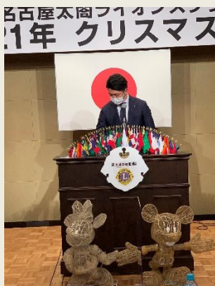
閉開会のゴングを会長L森戸