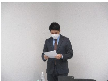
社会福祉長報告 幹事 L森戸