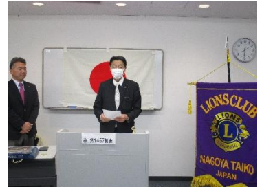
ライオンズの誓い L郷司