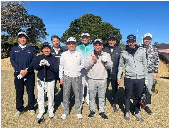
かごしま空港36カントリークラブにて