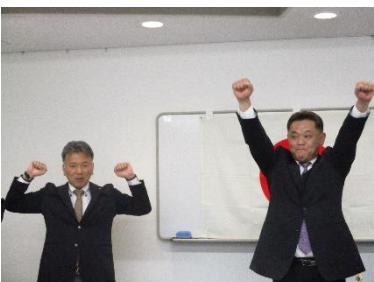
ライオンズローア L宮地