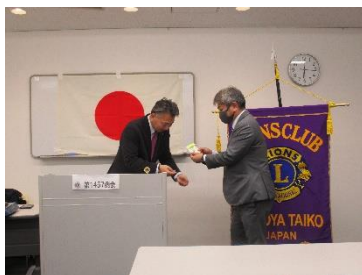
LCIFライオンズ・サポーター ピンの贈呈 L加納