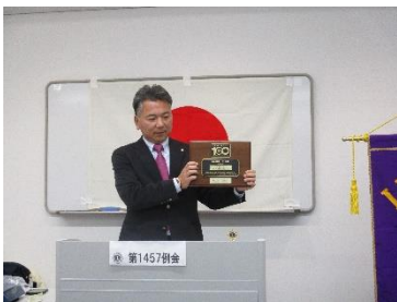
LCIF400%モデルクラブ 盾の披露