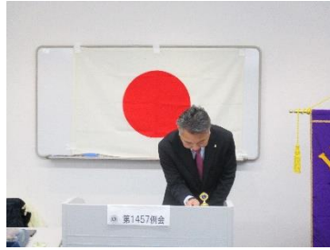
開会のゴング 会長L小泉