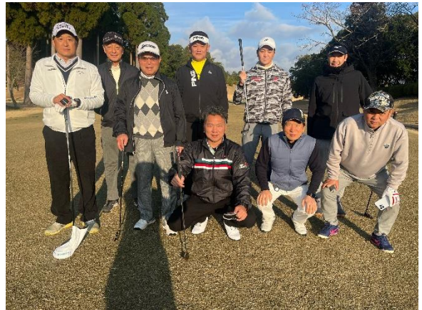
溝辺カントリークラブにて