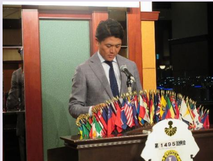
本日の出席率の報告 L森戸