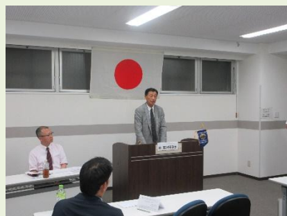
出席率の報告 L郷司