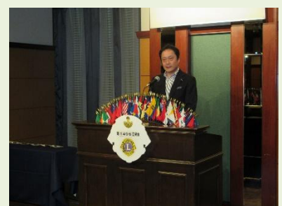
金沢兼六LC挨拶 CN60実行委員長L浅岡