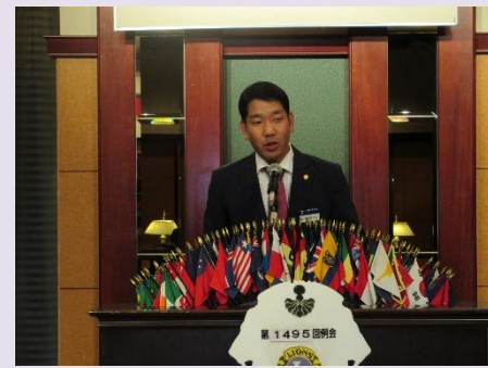
会員増強チーム L嘉和知