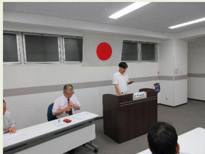
委員長報告 計画大会長L畑田