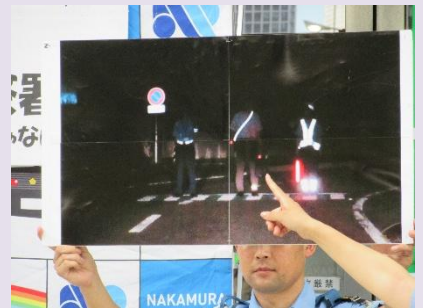
反射材使用状況の説明