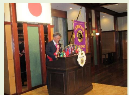
ライオンズの誓い L加納