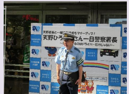
中村警察署長の挨拶