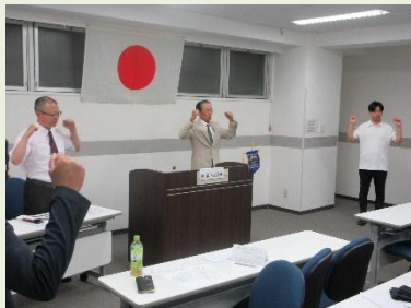
ライオンズローア L森