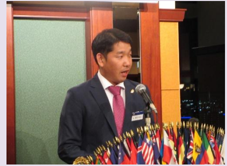
本日の会計報告 L嘉和知