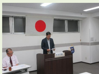
本日の会計報告 L嘉和知